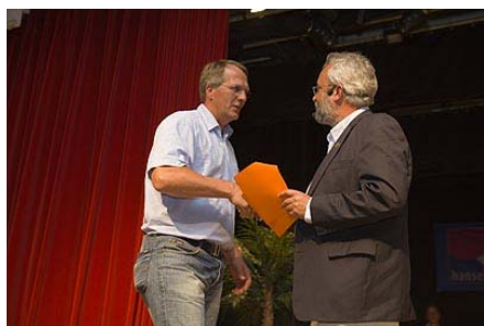
Pokale für die Lofot (Platz 1,1,1)