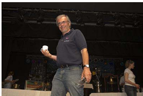
Pokal für die Burrasca (Platz 5,2)